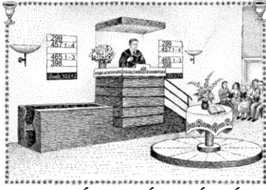
PASARÉTI PRÉDIKÁCIÓK refpasaret.hu